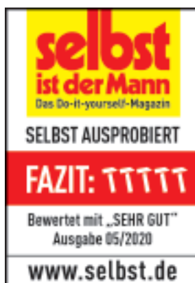
AVA Master P80 www.selbst.de