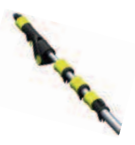
Teleskoplanze 4 m