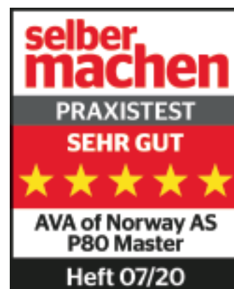
AVA Master P80 www.selbermachen.de